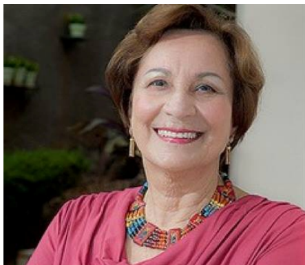
Presidente Ivani Fava Neves

A Mucapp é uma ONG enxuta e transparente, cujos recursos são gastos com parcimônia e sua prestação de contas é feita através de relatórios minuciosos.